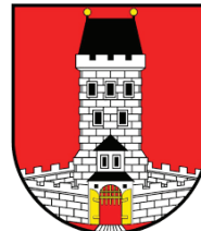
Světlá nad Sázavou