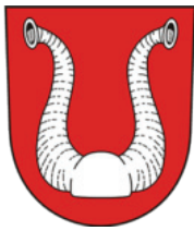
Zruč nad Sázavou