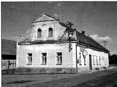
Hospoda v Jankovicích

rychtáři, který stál v čele vsi. Rychtář se mohl nazývat Janek, byla to tedy ves lidí Jankových, nebo se nazýval rychtář Koza a byla to ves lidí Kozákových. Rychtář sídlil na rychtě (gruntu), vrchností mu byl vyměřen větší lán polí, spravoval ves a konal nařízení daná vrchností. Pole byla lidem v obci při jejím zakládání přidělována. Rychta byla dědičná, mohla se i prodat. Často se takoví rychtáři nebo jejich potomci povznegli do stavu vladyckého.